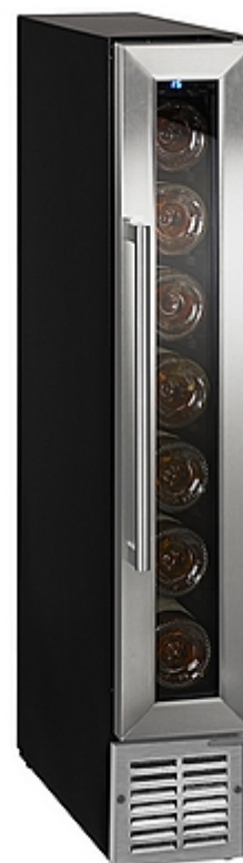
Version plinthe inox