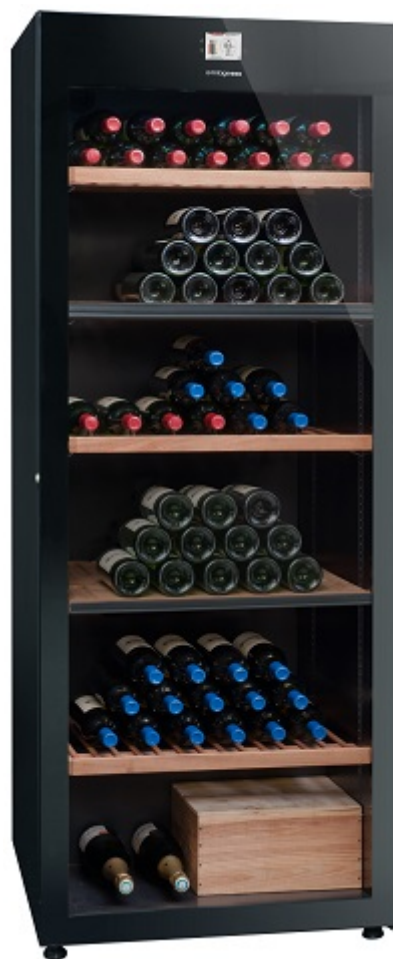
Configuration standard 3 zones

- Accessoires disponibles pour adapter votre cave à vos besoins (clayettes fixes ou coulissantes, kit de présentation, clayettes COLLECTOR, etc.)